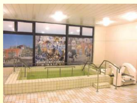
大浴槽、座位リフト浴槽

食堂ホール、ミニキッチン、浴室(大浴場、座位リフト浴槽、寝位リフト浴槽、 ユニットバス)、洗面所、トイレ、エレベーター、全館床暖房