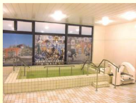
大浴槽、座位リフト浴槽

食堂ホール、ミニキッチン、浴室(大浴場、座位リフト浴槽、寝位リフト浴槽、 ユニットバス)、洗面所、トイレ、エレベーター、全館床暖房